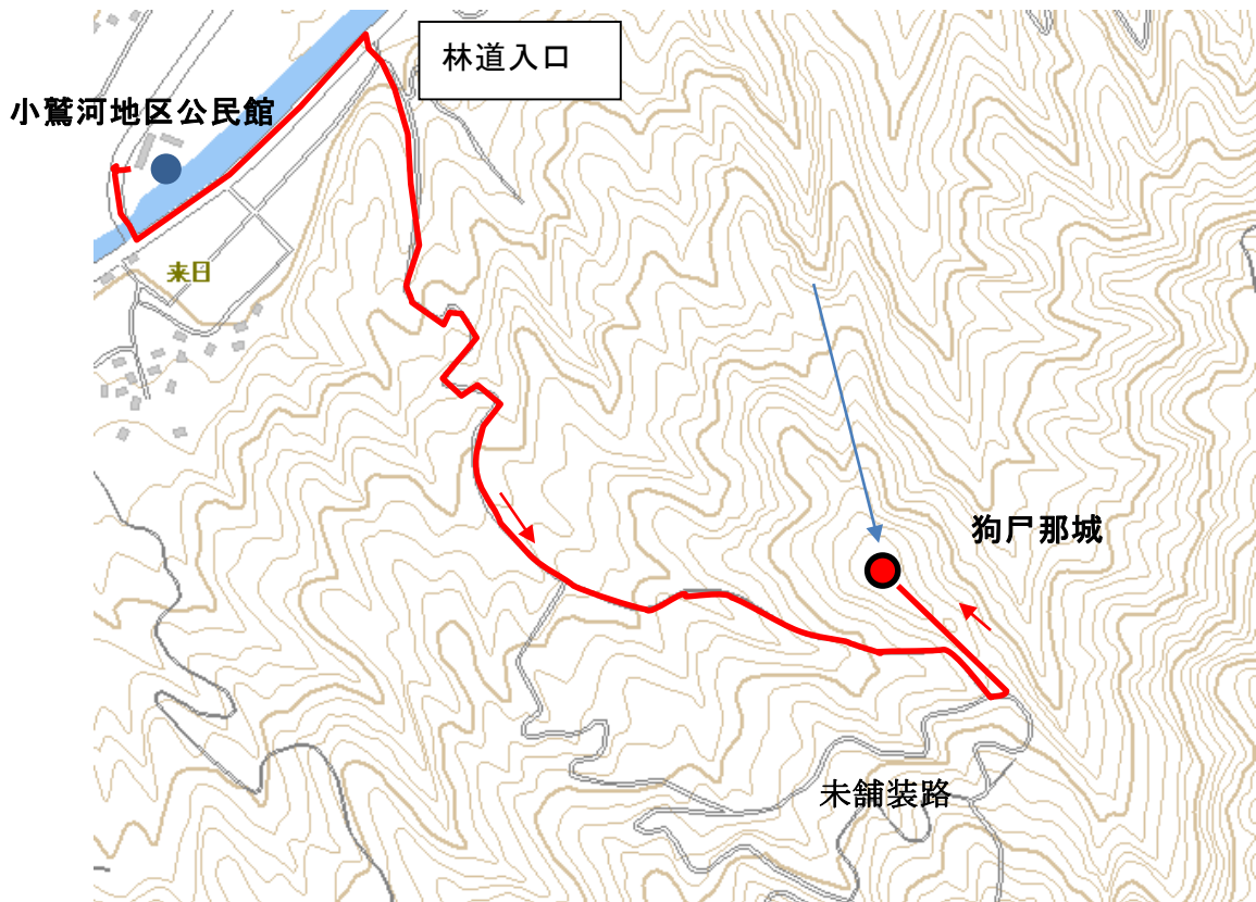
狗尸那城跡の位置とルート