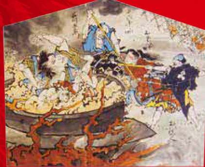
「釜淵双級巴(24点の内)」 絵馬提灯・紙本彩色 創造広場「アクトランド」 ※2点とも