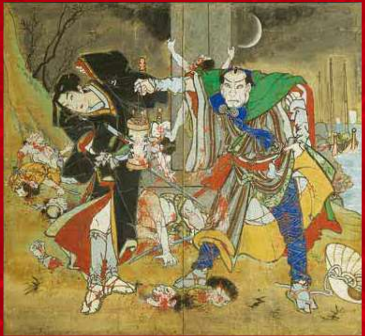
「浮世柄比翼稲妻 鈴ヶ森」 二曲一隻屏風・紙本彩色 香南市赤岡町本町一区