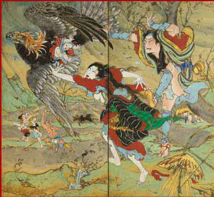
「花衣いろは縁起 鷲の段」 二曲一隻屏風・紙本彩色 香南市赤岡町本町二区