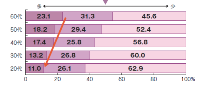
小学校4～6年生の頃にすもうや、おしくらまんじゅうをしたことへの推移