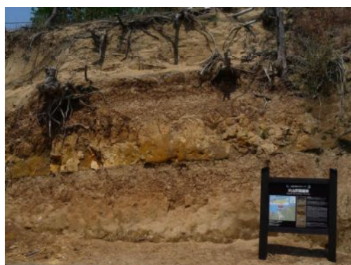
鳥取砂丘の火山灰層が確認できる露頭

自然講座当日に取材いただきまして、火山灰の観察の様子を広く皆さまにご紹介いただきますようお願いいたします。