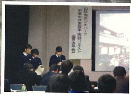
↑昨年度の発表の様子