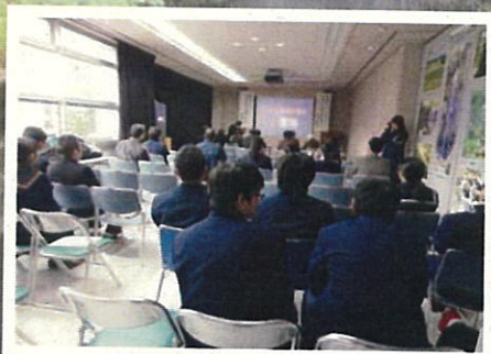
↑昨年度の審査会の様子