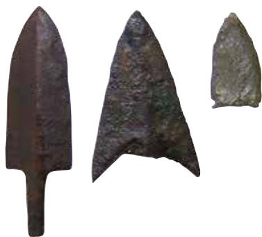
鳥取市 乙亥正屋敷廻遺跡出土の銅のやじり