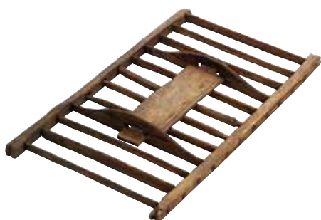
鳥取市 松原田中遺跡出土の田下駄