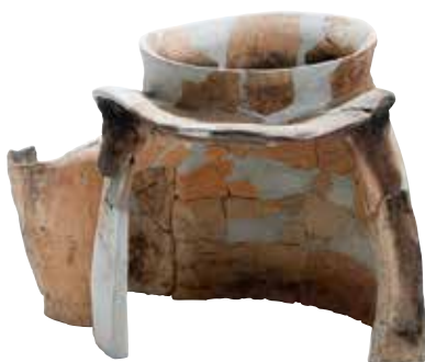
鳥取市 高住牛輪谷遺跡出土の古墳時代のかまど