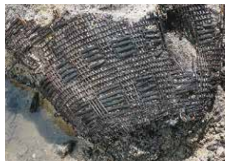
鳥取市 高住井手添遺跡出土の縄文時代のカゴ