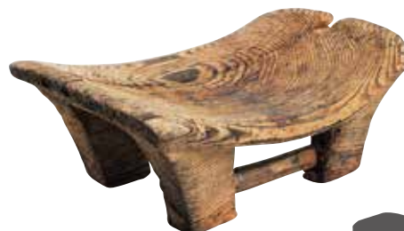
鳥取市 乙亥正屋敷廻遺跡出土の腰掛