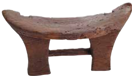
鳥取市 青谷横木遺跡出土の腰掛