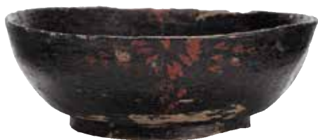
鳥取市 下坂本清合遺跡出土の漆器椀

参加費 [申込先] 鳥取県埋蔵文化財センター 申込み [申込方法] 2/1金9:00~3/15金まで電話にて受付(先着順) TEL:0857-27-6711(平日のみ)