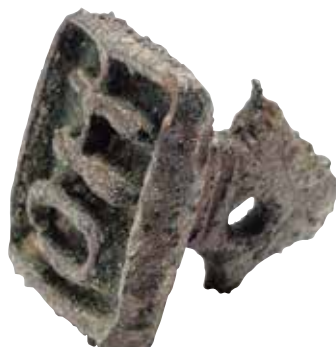
鳥取市 下坂本清合遺跡出土の古代の銅印