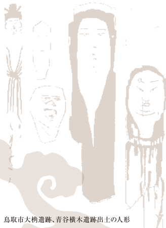
鳥取市大納遺跡、青谷横木遺跡出土の人形