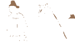
鳥取市青谷横木遺跡出土の板絵