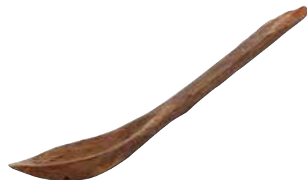
鳥取市 松原田中遺跡出土のさじ