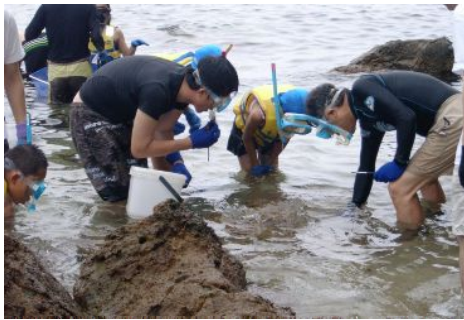
昨年の「磯の観察会」の様子

観察会当日に取材いただきまして、観察会の様子を広く皆さまにご紹介くださいますようお願いいたします。