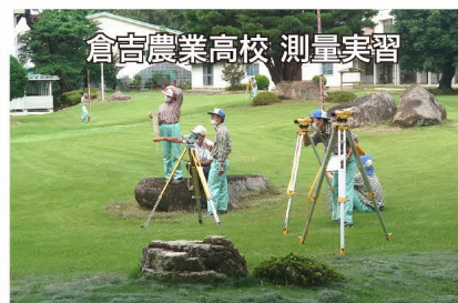
倉吉農業高校 測量実習