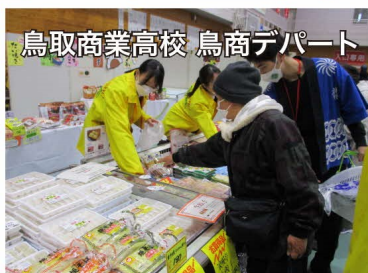
鳥取商業高校 鳥商デパート