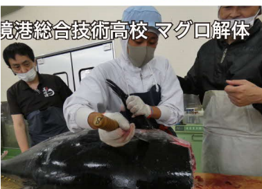
境港総合技術高校 マグロ解体