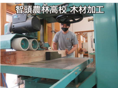
智頭農林高校 木材加工