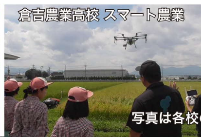
倉吉農業高校 スマート農業