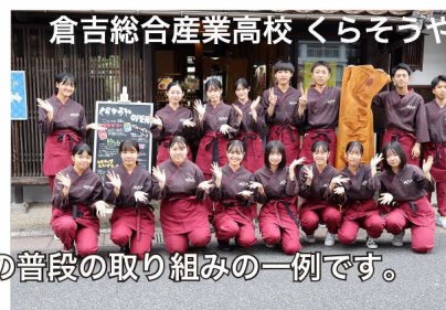
倉吉総合産業高校 くらそらや