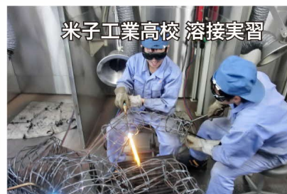
米子工業高校 溶接実習