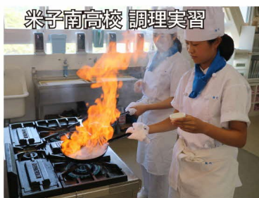
米子南高校 調理実習