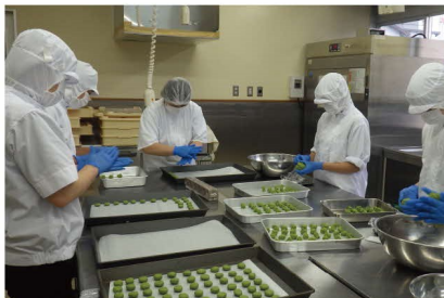
琴の浦高等特別支援学校