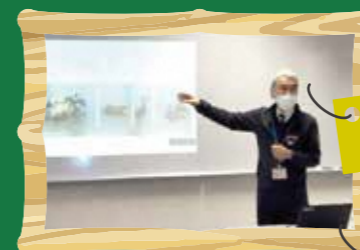
理科の時間 生物のなかまわけ

★鳥取県にこれまでにない形の公立の中学校です。鳥取市湖山町北にある鳥取県教育センター情報 教育棟1階に設置されます。入学までの学びの状況により、一人ひとりに合わせた学習を進めて いく夜間中学です。パソコンやタブレットも使いながら、週5日、1日4時間の授業を行います。