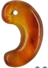
メノウ製勾玉 ●米子市上ノ山古墳出土 ●当館蔵

縄文時代に始まる勾玉の歴史は、古墳時代の終焉とともにアクセサリーとしての役割は終えましたが、その後もさまざまな役割を担いながら命脈を保ち続け、今もなお現代まで人々に愛され続けています。それは勾玉が素材や形を変えつつその時々ニーズに対応してきた結果でもあるのです。 本展ではこうした勾玉の歴史を辿りながら多様な側面に光をあて、現代の私たちをも魅了し続ける勾玉の謎に迫ります。