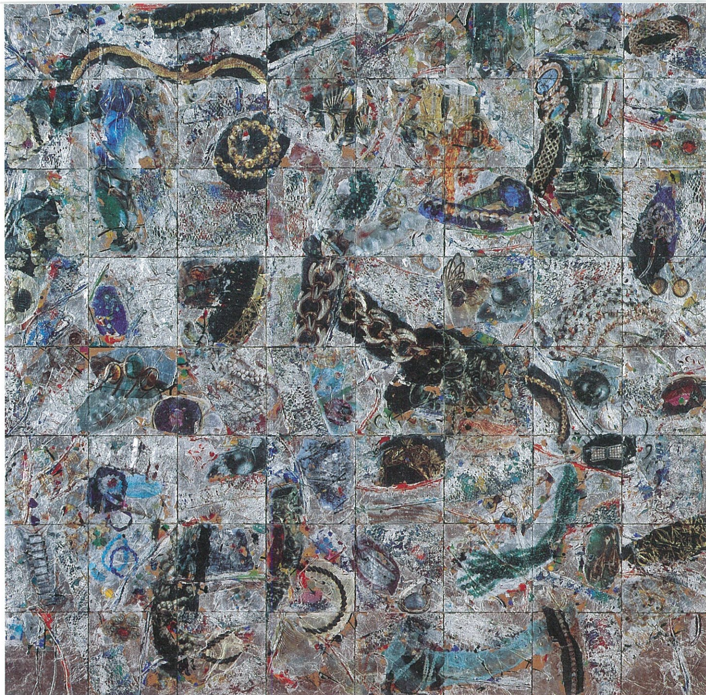
《遺景-WISH YOU WERE HERE》1994年 パネル・紙・銅箔・アクリル・岩彩 個人蔵