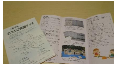
公園マップ・リーフレット