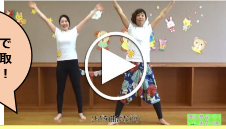
ワクワク親子deダンス（動画配信）