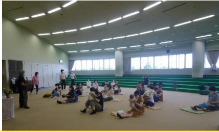
手をかけ、目をかけ、心をかけ ことばを添えて

子育ての早い段階から人と人とのつながりを構築し、子育ての悩み・不安の軽減を図ることを目的として、例年前期（5～7月）、後期（9月～11月）で各5講座年間10講座程度、乳幼児期の子の親が子育ての知識、技術及び心を学ぶことのできる講座を開催しています。