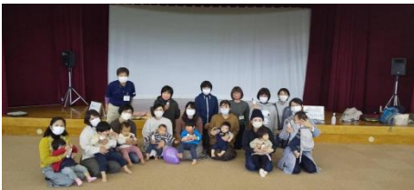
子育てサークル支援活動

平成22年7月に、米子市家庭教育支援チーム「とことこ」カレンダー＆応援ブック（初版）を発行し、その後必要に応じて改訂版の発行を行っています。また、平成27年から2年間かけて米子市内の全公園調査を行い、公園マップを作成及び配布しました。米子市内、西部地区内子育て支援センター、子育てサークル（公民館）、米子市児童文化センター等を訪問し、利用者に対して子育てに関する情報収集や提供、相談や遊びの支援を行っています。