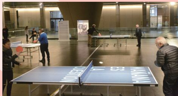
リクリット・ティラヴァニ 《Untitled 2016 (tomorrow is the question-mañana es la cuestión)》 CCK, Buenos Aires, Argentina