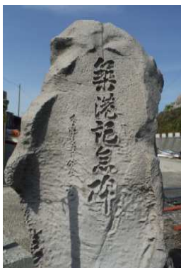
夏泊漁港築港記念碑