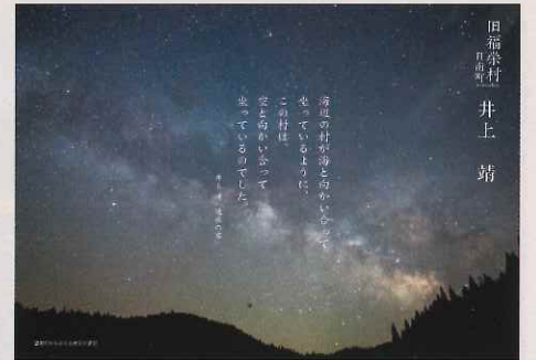
井上 靖 『通夜の客』には旧福栄村(日南町)の美しさを表現