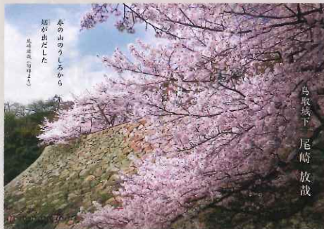
尾崎 放哉 「咳をしても一人」の自由律俳句で知られる「漂泊の俳人」(現鳥取市出身)

郷土出身文学者シリーズ特別編 『とっとり文学の情景』増補版 企画・編集 鳥取県立図書館 発行 平成30年3月