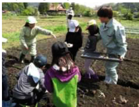
アグリライフ系列農業体験交流