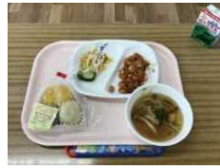
〇日野探究Ⅱ 3町3色パン