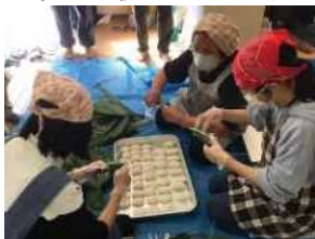
地域交流（笹餅づくり）