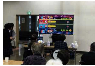
ヒューマンケア系列Weスポーツ