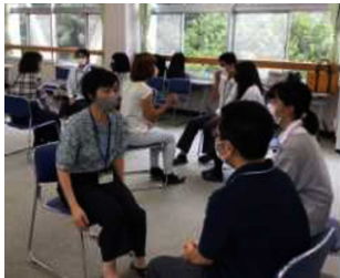
「産業社会と人間」おしどりトーク