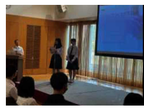
中山間地魅力化フォーラム