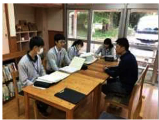
日野探究Ⅰ 白谷工房