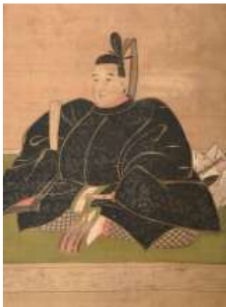
3代藩主池田吉泰画像(当館 色々威胴丸具足(池田吉泰所用甲冑)(当館蔵)