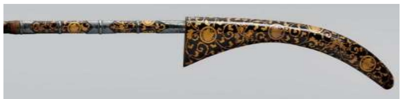
梅唐草蝶文蒔絵薙刀拵の先端部分拡大