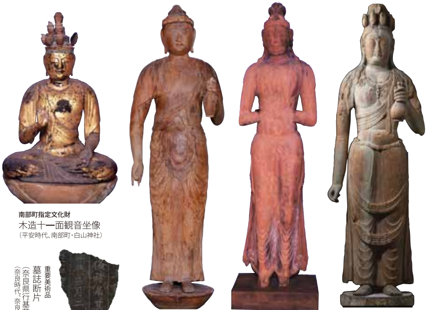
南部町指定文化財 木造十一面観音坐像 (平安時代、南部町・白山神社)