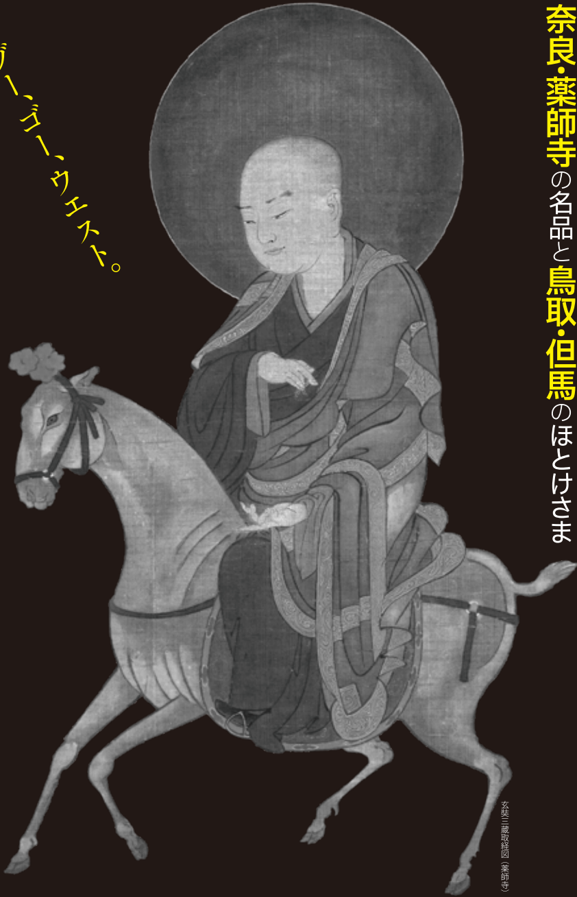
女体三蔵法師図(薬師寺)