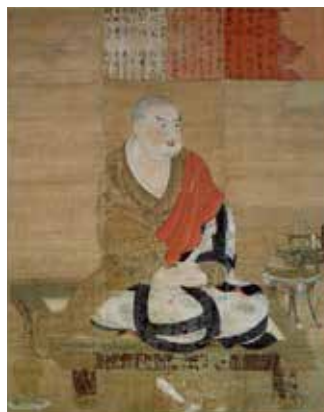
国宝 慈恩大師像(平安時代、薬師寺)