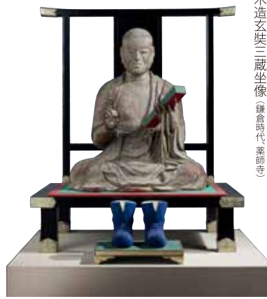
木造玄奘三蔵坐像(鎌倉時代、薬師寺)