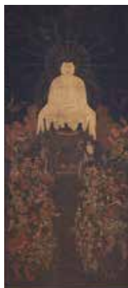
重要文化財 釈迦十六善神像 (南北朝時代、兵庫県香美町黒野神社)