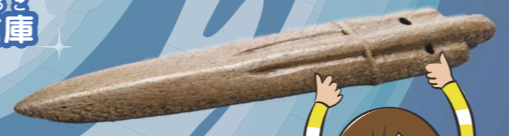
くじらの骨で作られた剣