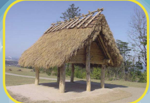
食べ物を取っておく高床倉庫