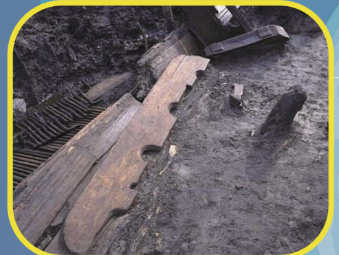
倉庫などの建築部材