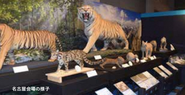
名古屋会場の様子