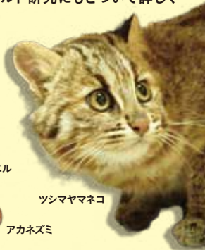
ツシマヤマネコ アカネズミ