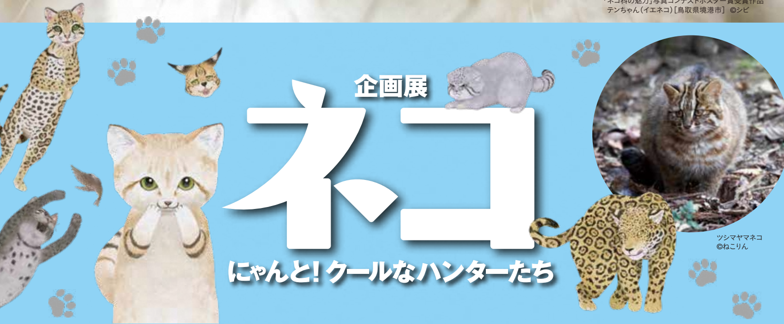
ツシマヤマネコ

「ネコ科の魅力」写真コンテストポスター賞受賞作品 テンちゃん(イエネコ) [鳥取県境港市]