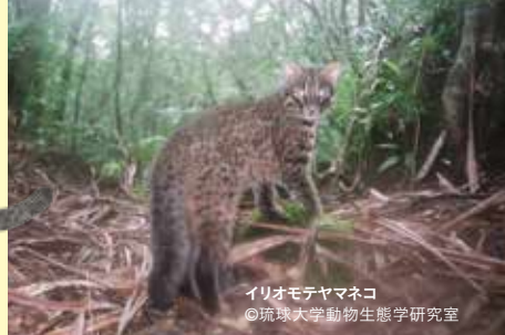
イリオモテヤマネコ