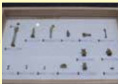
長崎県カラカミ遺跡から出土した日本最古のイエネコの骨 (香川県教育委員会蔵)