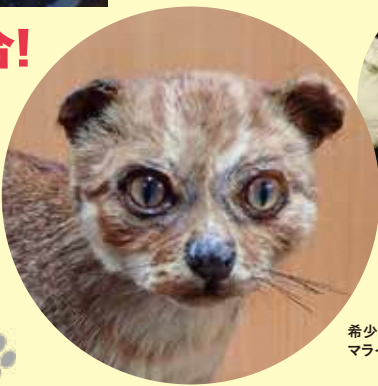
ディンクティス 実物化石