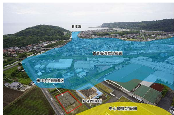
弥生時代の環境と第19次発掘調査区の位置