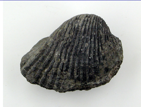
カケハタアカガイ