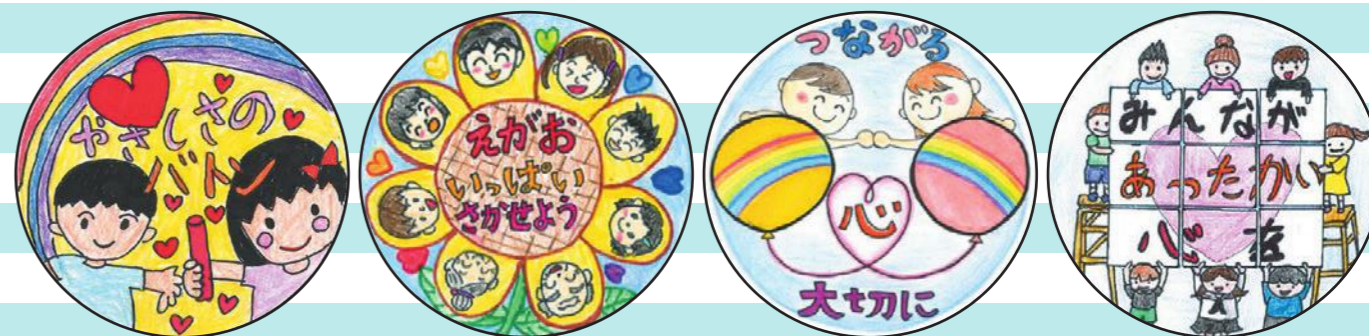
【令和元年度 最優秀作品より】