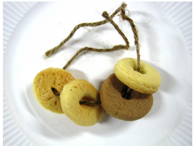
レシピ・青谷町地域活性化委員会賞 『貨泉ビスケット』