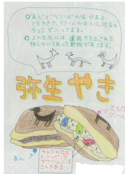
アイデア・青谷町地域活性化委員会賞『弥生やき』