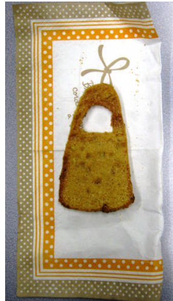
レシピ・青谷かみじち賞『銅鐸のクッキー』