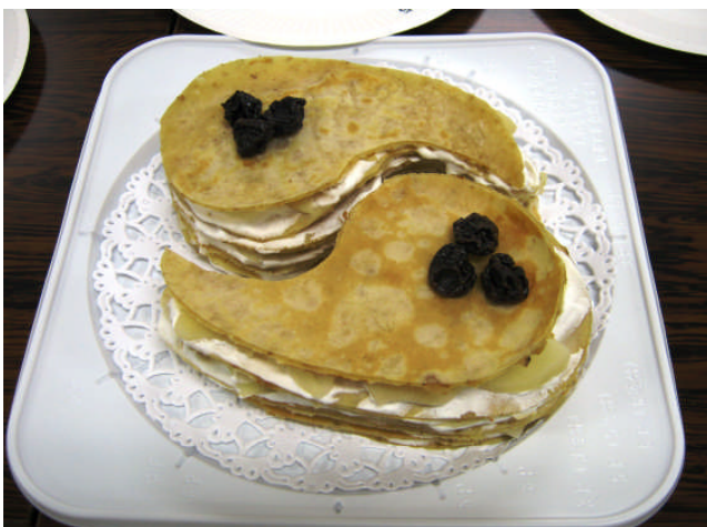
レシピ・鳥取県菓子工業組合賞 『まがたまのクレープ』