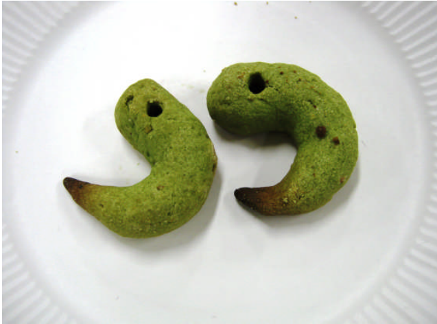
レシピ・むきばんだ賞『ほろほろ勾玉クッキー』