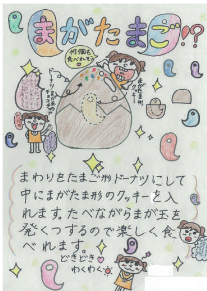
アイデア・鳥取県菓子工業組合賞『まがたまご!?!』