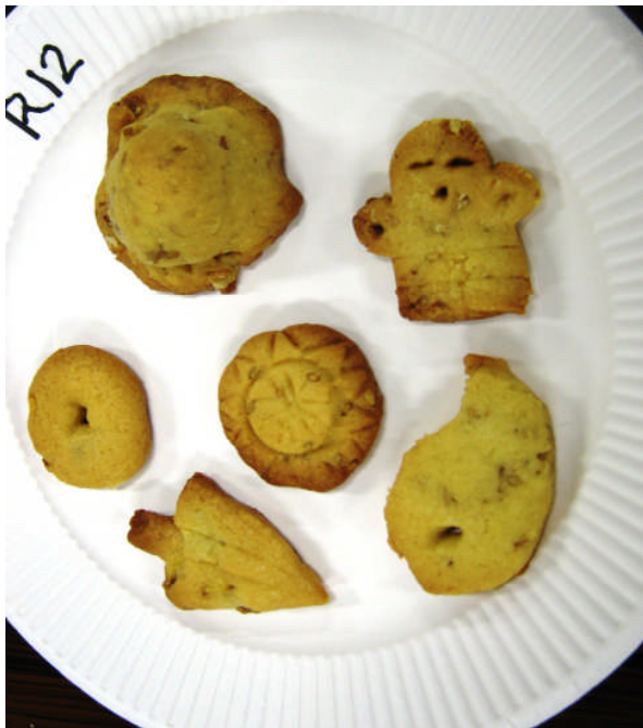
レシピ・妻木晩田物産振興会賞 『ハニークッキー』