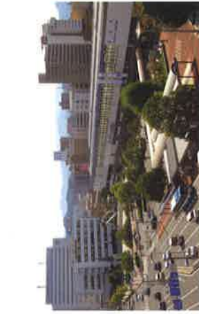
地上定点写真・鳥取駅前 (左:1968年、右:2018年)