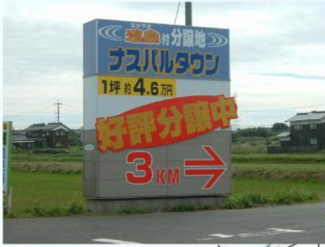
国道9号線入り口の目印