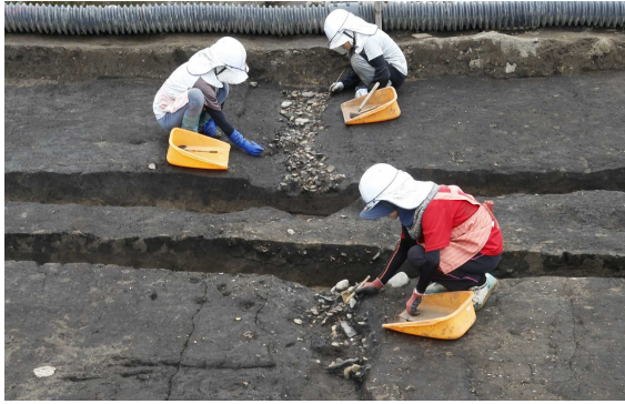
土器が捨てられた溝の調査状況