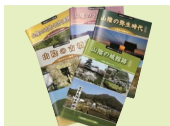
一気にそろえるチャンス!

※個人情報は「さんいん史跡日和2018」スタンプラリー景品発送のみに利用します。