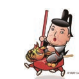
案内人 みつなかくん 江戸時代のことならおまかせあれ〜。