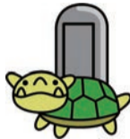
案内人 きつぶん 池田家関連グッズの販売もあるよ!