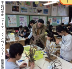
平成28年度「アーティストとつながる」授業風景