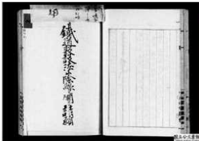
山陰線敷設の請願書〈明治28年〉 （国立公文書館蔵）