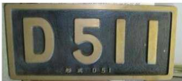
D511号機ナンバープレート （米子市立山陰歴史館保管）

米子電車は、大正14年から昭和13年まで米子市内を走った路面電車〈県内初公開〉。