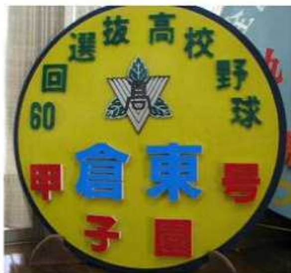
甲子園応援列車〈昭和63年〉 ヘッドマーク（倉吉東高等学校蔵）