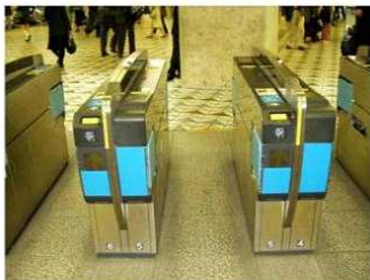
自動改札機（オムロン社製）〈参考画像〉