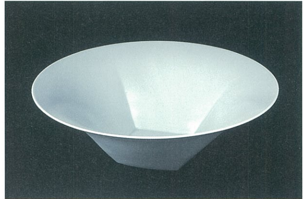
1.《白瓷面取壺》1991年 磁器 第11回日本陶芸展 優秀作品賞受賞 2.《白瓷刻文蓋物》1993年 磁器 第48回新匠工芸展 富本賞受賞 3.《白瓷面取鉢》2003年 磁器 第50回日本伝統工芸展 第50回展記念賞受賞 所蔵先はすべて鳥取県立博物館 写真撮影：1.と2. 斎城卓、3. 山本慶治