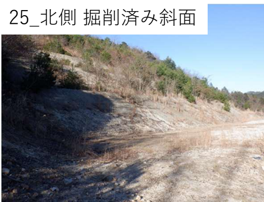
25_北側 掘削済み斜面