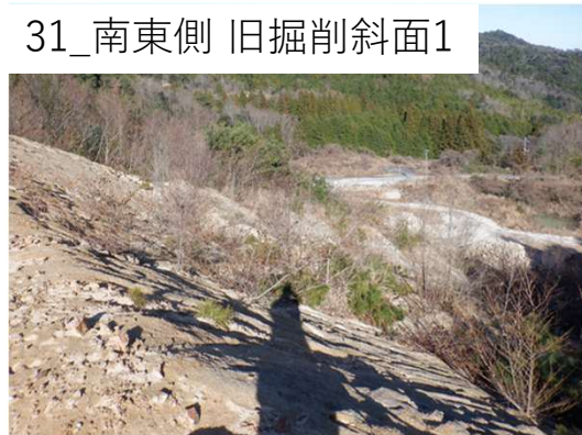
31_南東側 旧掘削斜面1