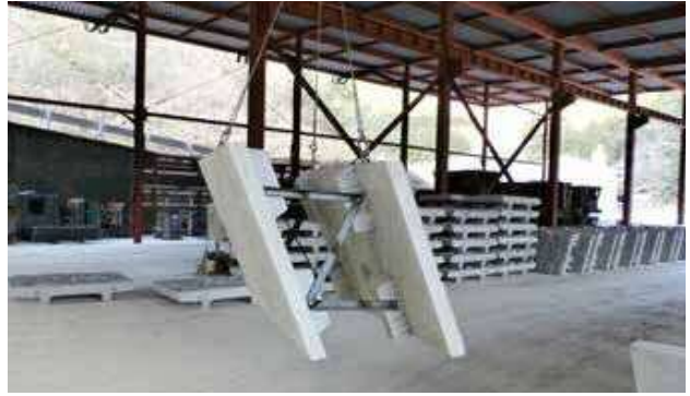
(1.861m 2 )