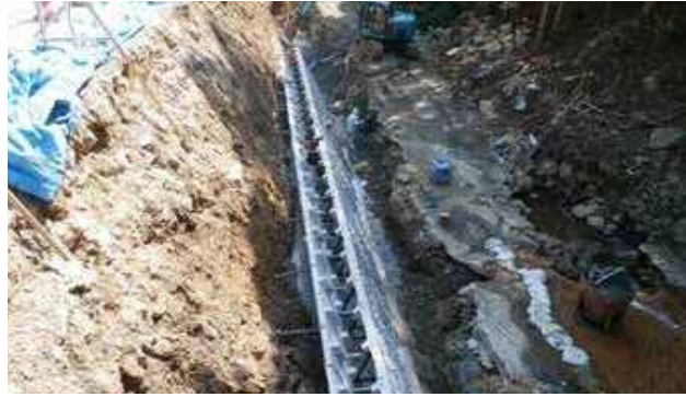
(1.861m 2 )