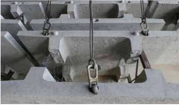
DHクッパーによる点吊り(当社より貸出)