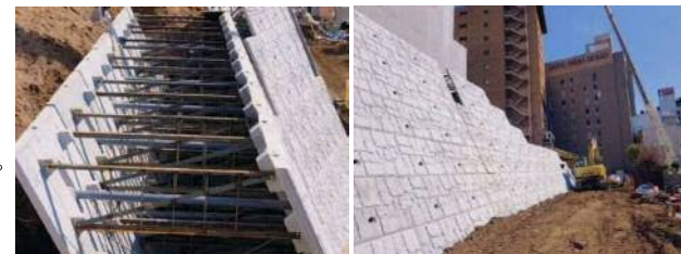
大型擬石1.861㎡タイプ 規格諸元 (等厚式法勾配5分の場合)

※基礎部上面には必ず差筋(用心鉄筋)をしてください。 ※中詰めコンクリートは1段ごとに投入し、ブロック天端より20cm程度打ち残して打設終了して下さい。(ただし、最上段は天端まで) ※標準型(A型)1個の面積は、1.861㎡です。※10m以内に目地を設置してください。