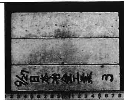
写真-1 供試体の状況(試験終了時)