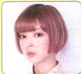
ゲストパネリスト 最上もがさん タレント