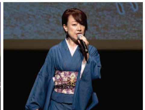
共同ライブコンサートの様子