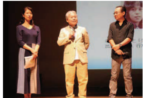
被害者御家族による呼びかけの様子

(※)「特定失踪者」とは、民間団体である「特定失踪者問題調査会」が、 「北朝鮮による拉致かもしれない」という御家族の届出等を受けて、独自に調査の対象としている失踪者のこと。