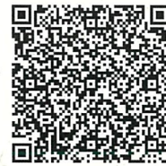
申込み QR コード

<Eメール> sogoryoikucenter@pref.tottori.lg.jp